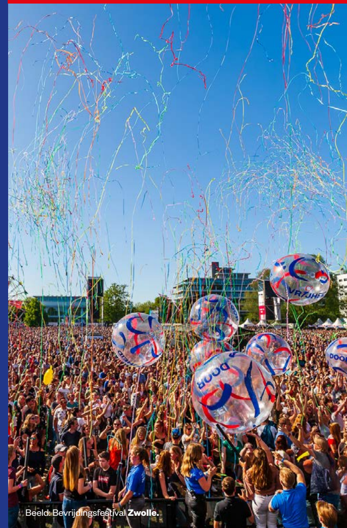
Beeld: Bevrijdingsfestival Zwolle.